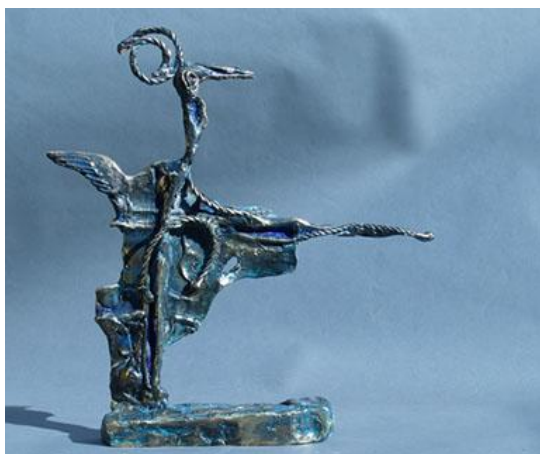
L'oiseau rare, bronze, 42 x 42 x 11 cm