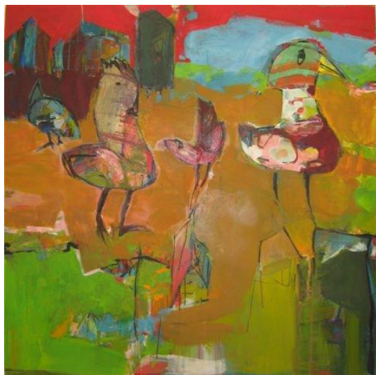
Sans titre 5, technique mixte sur toile, 120 x 120 cm