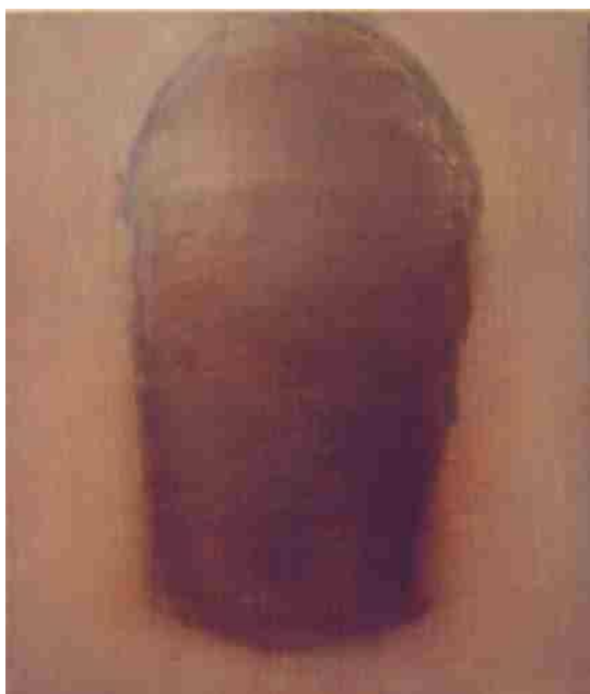
Sans titre, huile sur toile, 49 x 60 cm

http://hernan-torres.com/sculptures.html