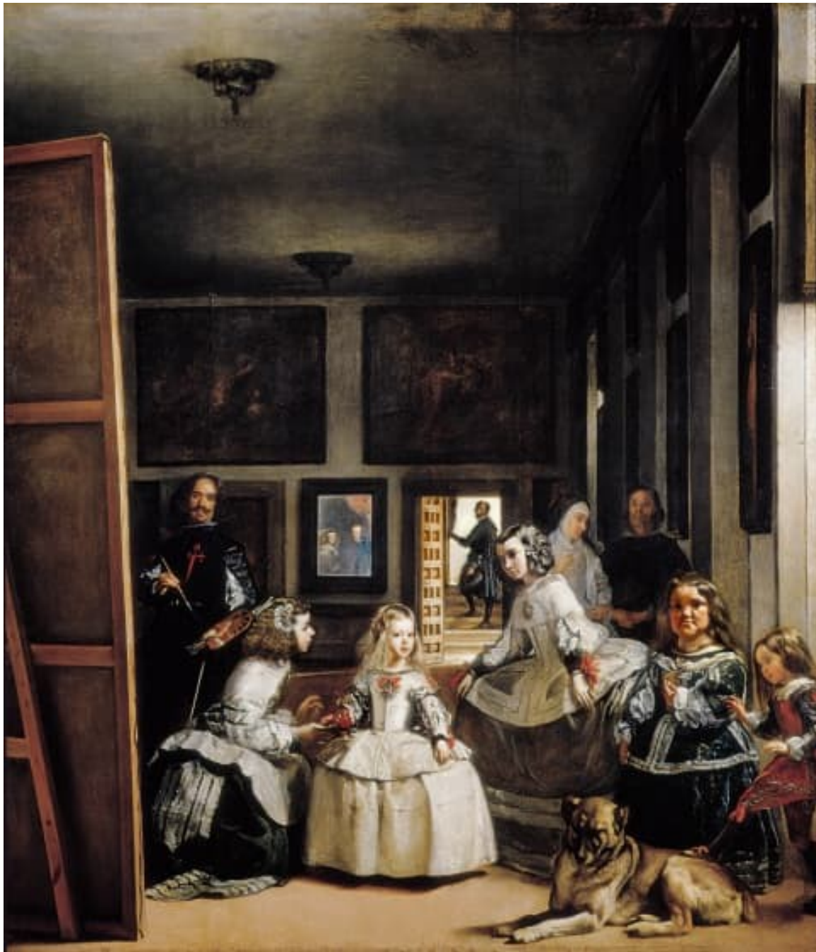
Diego VELAZQUEZ « Les Ménines » 1656